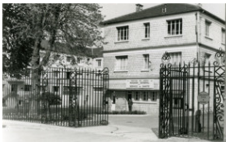
◆ n°5. Référence : REP1977-ECMMS-001-0010 Entrée du Magasin général du Service de santé. Mondeville, 1977, photographe inconnu ECPAD / Collection ECMM

À partir de 1987, l'organigramme du ravitaillement sanitaire fait apparaître la fusion du MGSS et de la PGSS en un seul Établissement central de matériels de mobilisation. La restructuration laisse place à neuf établissements centraux et douze établissements régionaux. La création de l'ECMM coïncide avec la fermeture de l'annexe de la Pharmacie centrale à Châteauroux et avec la transformation du Magasin central du Service de santé d'Ardentes en Établissement régional de matériels de mobilisation. L'ECMM reçoit alors les stocks de réserve de mobilisation de ces deux organismes et prend à son compte leurs missions de constitution.