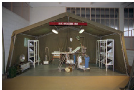
◆ n°30. Référence : REP199X-ECMMS-001-0032 Bloc opératoire de 1950 reconstitué et exposé au Conservatoire de l'Établissement central de matériels de mobilisation. Mondeville, années 1990

Après avoir vu ses activités renforcées par les restructurations successives du Service de santé des armées, l'ECMM a été dissout en 2009 par une nouvelle réforme. Les activités de ravitaillement sanitaire sont désormais regroupées en un pôle spécialisé regroupant les sites de Vitry-le-François, Orléans et Marseille.