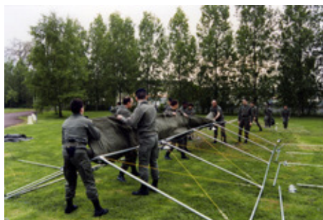
◆ n°27. Référence : REP1994-ECMMS-006-0028 Exercice pratique de montage d'une tente pendant le stage de l'École des officiers du corps technique et administratif du SSA. Mondeville, 9 au 11 mai 1994