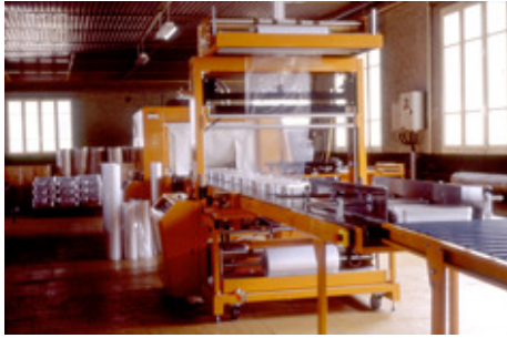
◆ n°19. Référence : REP199X-ECMMS-002-0017 Vue générale de l'ensemble de conditionnement sous film plastique. Au premier plan, le convoyeur, puis le portique supportant le film plastique, et enfin le tunnel de rétractation. Mondeville, années 1990, photographe inconnu ECPAD / Collection ECMM