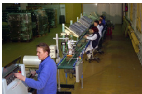
◆ n°17. Référence : REP1997-ECMMS-004-0014 Chaîne de constitution des lots. Mondeville, 1997