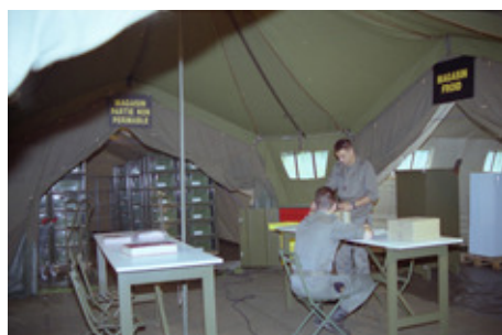
♦ n°10. Référence : REP1995-ECMMS-016-0003

À partir de 1987, l'Établissement central de matériels de mobilisation prend le relais de ces deux établissements. Le service courant vers la métropole et Papeete, l'instruction et le soutien des approvisionnements de la Réserve régionale de mobilisation sont remplacés par une mission régionale de soutien des formations de l'armée de Terre et de la Marine, et des missions nationales de constitution des dotations techniques de mobilisation et d'approvisionnement en matériels et médicaments des formations sanitaires déployées en opération. À ce titre, l'ECMM a apporté son soutien aux unités déployées dans le Golfe, au Kosovo, en Côte-d'Ivoire et en Afghanistan.