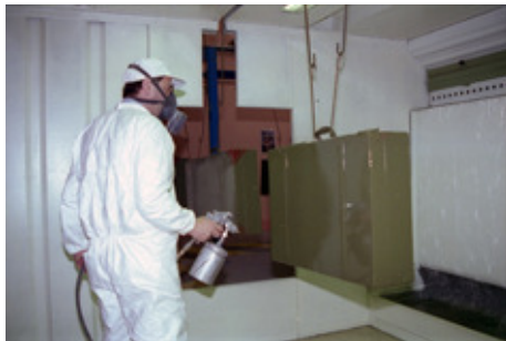
◆ n°21. Référence : REP1996-ECMMS-007-0004 Atelier Peinture de l'Établissement central de matériels de mobilisation. Mondeville, 1996

L'atelier Peinture est chargé des mobiliers et contenants métalliques et de la caisserie des formations sanitaires de campagne (FSC).