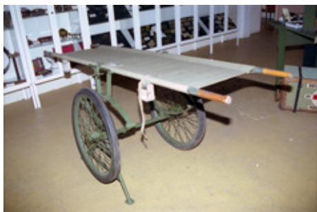
◆ n° 29. Référence : REP1997-ECMMS-011-0001 Voiturette porte-brancard pliante américaine de la 2 e Guerre mondiale, exposée au Conservatoire de l'Établissement central de matériels de mobilisation. Mondeville, 1997