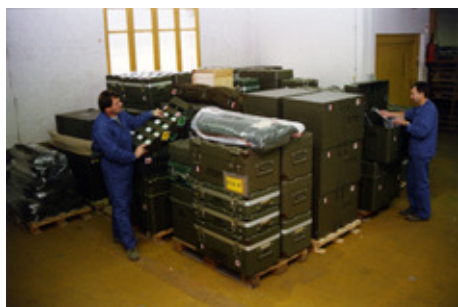
◆ n°15. Référence : REP1997-ECMMS-003-0017 Préparation de l'envoi de matériels pour antenne chirurgicale aéroportée (ACA). Mondeville, 1997

Le cycle de production comporte l'ensemble des activités nécessaires à la constitution et au conditionnement d'unités et sous-unités sanitaires. La constitution des lots se fait manuellement. Chaque objet est vérifié individuellement et la cellule « contrôle qualité » apporte son expertise technique pour contrôler chaque lot.