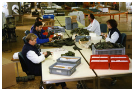
◆ n°16. Référence : REP1997-ECMMS-003-0012 Contrôle qualité des lots. Mondeville, 1997