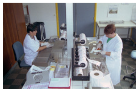
◆ n°22. Référence : REP199X-ECMMS-001-0065 Atelier de stérilisation et de constitution de lots chirurgicaux. Mondeville, années 1990

La cellule Stérilisation stérilise et conditionne les instruments chirurgicaux.