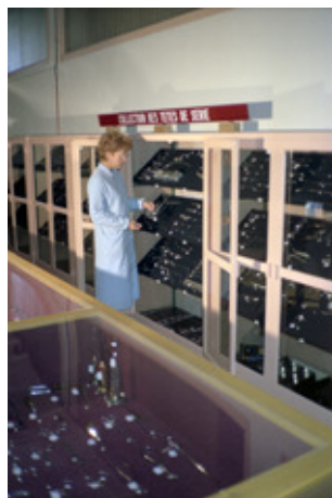
◆ n°28. Référence : REP199X-ECMMS-012-0004 Collection de têtes de série du Conservatoire de l'Établissement central de matériels de mobilisation du Service de santé. Mondeville, années 1990, photographe inconnu ECPAD / Collection ECMM

La présence d'un Conservatoire des matériels de mobilisation à Mondeville répond à un besoin permanent de références techniques, afin de normaliser les approvisionnements et les produits. Il constitue la base de référence pour vérifier la conformité d'un stock à son modèle-type. Son rôle est de regrouper tous les matériels qui ont fait ou font partie des compositions des dotations et maintenances de mobilisation.