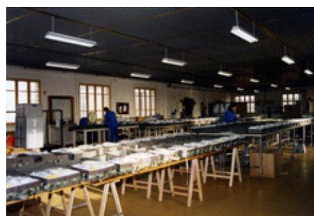
◆ n°18. Référence : REP199X-ECMMS-001-0197 Chaîne de constitution des lots. Mondeville, années 1990

Depuis 1988, l'atelier de production des unités et sous-unités collectives dispose d'un ensemble de conditionnement sous emballage plastique, l'emballage pouvant être à l'unité ou de plusieurs objets. Le tunnel d'emballage se compose de cinq parties :