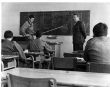
◆ n°26. Référence : REP1977-ECMMS-001-0014 Salle de cours des stagiaires. Mondeville, 1977, photographe inconnu ECPAD / Collection ECMM

Par la suite, l'ECMM organise des stages de formation pour les officiers du corps technique et administratif du Service de santé des armées (OCTASSA) et forme les réservistes.