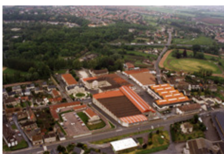
◆ n°4. Référence : REP1995-ECMMS-007-0003

Le 1 er janvier 1987, le MGSS et la PGSS de Mondeville fusionnent pour donner naissance, sur le même site, à l'Établissement central de matériels de mobilisation (ECMM) du Service de santé. Cette réorganisation se place dans un contexte plus large de restructuration du dispositif de ravitaillement sanitaire du SSA : « La constitution, l'entretien et le stockage des approvisionnements de mobilisation seront confiés à des Établissements régionaux des matériels de mobilisation (ERMM) placés sous l'autorité des directions du service de santé des régions concernées et à un Établissement central des matériels de mobilisation placé sous les ordres de la DAEC [Direction des approvisionnements et des établissements centraux du SSA]. [...] La création de l'ECMM de Mondeville doit permettre d'améliorer et de rationaliser la gestion des stocks de la réserve de mobilisation et l'entretien des formations sanitaires de campagne. » 3