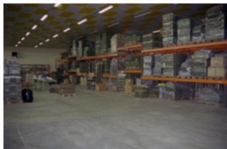
◆ n°6. Référence : REP1999-ECMMS-008-0045 Magasin de stockage de l'Établissement central de ravitaillement sanitaire de Vitry-le-François. Vitry-le-François (Marne), 1999

La loi de programmation militaire de 1997-2002 entraîne la fermeture de six des sept établissements spécialisés dans les matériels de mobilisation et de trois des quatre pharmacies magasins de ports (PMP). Seuls subsistent l'ECMM de Mondeville et la PMP de Brest.