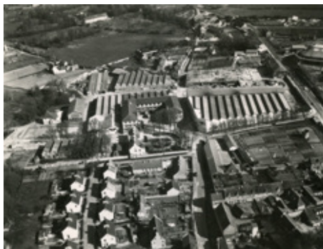
◆ n°3. Référence : REP1961-ECMMS-001-0003 Vue aérienne du site de Mondeville. Mondeville, mars 1961

Le Magasin général (MGSS n°39) et la Pharmacie générale du Service de santé (PGSS) assurent conjointement le ravitaillement des hôpitaux et des formations sanitaires de la 3 e Région militaire ainsi que l'entretien des dotations de mobilisation. Ils sont ainsi partie prenante du soutien sanitaire des Forces extérieures puis de la Force d'action rapide de 1978 à 1987.