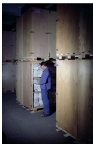
◆ n°11. Référence : REP199X-ECMMS-011-0003 Vérification de textiles stockés en armoires-palettes. Mondeville, années 1990

La conception traditionnelle du magasin de stockage, où chaque objet a sa place immuable dans une suite de rayonnage, coexiste avec le principe dynamique de « magasin aléatoire », adopté dans certaines zones de stockage de l'ECMM. Dans ce concept, chaque objet entrant est stocké à n'importe quel emplacement libre à condition qu'il soit localisé. L'inconvénient du repérage de l'objet dans le magasin est contrecarré par le repérage exact des emplacements par un système de fiches de stock. À cela s'ajoute l'utilisation de moyens de stockage mobiles. L'ECMM est l'inventeur de l'armoire-palette, fabriquée par ses ateliers. L'armoire-palette offre un triple avantage : facilitation du rangement, facilitation du chargement et mise à l'abri du contenu.