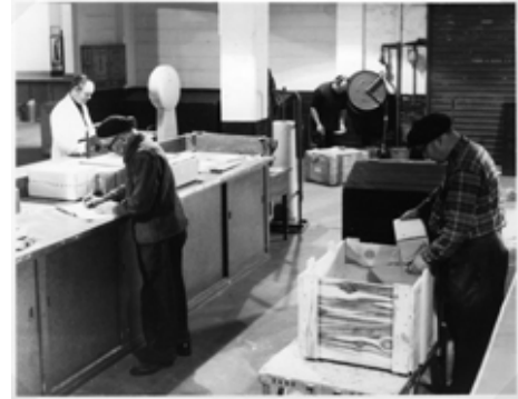
◆ n°20. Référence : REP1977-ECMMS-001-0007 Préparation des expéditions. Mondeville, 1977, photographe inconnu ECPAD / Collection ECMM