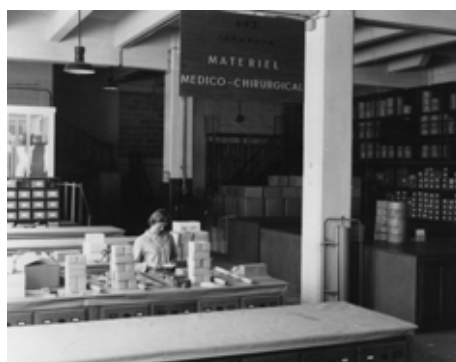
◆ n°12. Référence : REP1977-ECMMS-001-0011 Magasin de l'instrumentation chirurgicale au Magasin général du Service de santé. Mondeville, 1977, photographe inconnu ECPAD / Collection ECMM