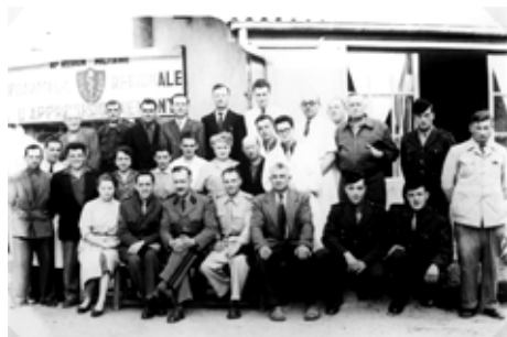
◆ n°2. Référence : REP1956-ECMMS-001-0001 Photographie de groupe du personnel de la Pharmacie régionale d'approvisionnement de Rennes. Rennes (Ille-et-Vilaine), 1956, photographe inconnu ECPAD / Collection ECMM

initiées en 1955. À cette date, le transfert du Dépôt du matériel régional (DMR) et de la Pharmacie régionale de la 3 e Région militaire de Rennes vers Mondeville est déjà envisagé et débute par l'affectation d'un détachement d'infirmiers pour assurer le gardiennage de l'usine de Mondeville 2 , les locaux appartenant toujours à l'Armement. Les premiers lots de matériels médicaux parviennent sur le site la même année, en provenance d'Indochine.